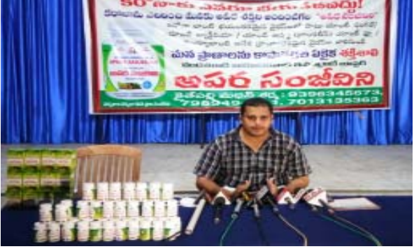
విజయవాడ, నేటి పత్రిక ప్రజా వార్త :నగరంలోని పేద ప్రజలు కరోనా బారినపడినా, కరోనా సోకుండా ఉండేందుకు అపర సంజీవని ఇమ్మూనిటీ బూస్ట్