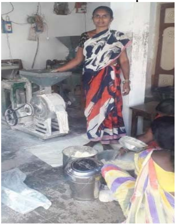
నూజివీడు, నేటి పత్రిక ప్రజా వార్త : ప్రతి పేద మహిళను ఆర్థిక శక్తిగా తీర్చిదిద్దేందుకు రాష్ట్ర ప్రభుత్వం చిత్తశుద్ధితో ముందడుగు వేస్తోంది. ప్రభుత్వం అమలు చేస్తున్న ఎన్నో సంక్షేమ కార్యక్రమాలను మహిళల పేరు మీదే ముంజూరు చేస్తున్నారు. అమ్మబడి, జగన్మమత వర్షం, వసతి దీవెన, ఇళ్ల స్థలాల పంపిణీ, వై.ఎస్.ఆర్ ఆసరా వంటి నవరత్నాలు కార్యక్రమాలలో మహిళలను అభివృద్ధి చేస్తుంటుంది.

వై.ఎస్.ఆర్. ఆసరా కార్యక్రమం రాష్ట్ర మహిళాభ్యుదయంలో మైలరాయిగా నిలుస్తోంది. వై.ఎస్.ఆర్. ఆసరా కార్యక్రమం రుణాల