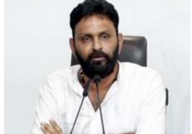
తాడేపల్లి, నేటి పత్రిక ప్రజా వార్త : రాష్ట్రంలో 75 ఏళ్ళ చరిత్రను సీఎం జగన్మోహన్ రెడ్డి తన రెండేళ్ళ పాలనలో తిరగరాసిన రాష్ట్ర పౌరసభలూ, వినియోగదారుల వ్యవహారాల శాఖ మంత్రి కొడాలి శ్రీవెంకటేశ్వరరావు (నాని) చెప్పారు. తాడేపల్లిలోని వైఎస్సార్ కాంగ్రెస్ పార్టీ కేంద్ర కార్యాలయంలో మంత్రి కొడాలి నాని మీడియాతో మాట్లాడారు. సీఎం జగన్మోహన్ రెడ్డికి 2014 లోనే అధికారాన్ని అప్పజెప్పి ఉంటే బాగుండేదని రెండేళ్ళ పాలన చూసిన తర్వాత ప్రజలు కోరుకుంటున్నారని, చంద్రబాబుకు అధికారాన్ని ఇచ్చి తప్పి చేశామని భావిస్తున్నారన్నారు. ఐదేళ్ళ పాటు చంద్రబాబుకు అధికారాన్ని అప్పజెప్పి రాష్ట్రాన్ని కుక్కలు చింపిన విస్తరిలా మార్చారన్నారు. రాజధాని పేరుతో అధికారాన్ని తన మనుషులు, వ్యవస్థలకు దోచి పెట్టారన్నారు. తెలుగుదేశం పార్టీకి ఓటు వేసిన బీసీలు, చంద్రబాబు సామాజిక వర్గానికి చెందిన వ్యక్తులు కూడా జగన్ పాలన చూసిన తర్వాత చంద్రబాబుకు ఎందుకూ అధికారాన్ని ఇచ్చి తప్పి చేశామని భావిస్తున్నారన్నారు. గత రెండేళ్ళలో రాష్ట్రంలో సంక్షేమ, అభివృద్ధి