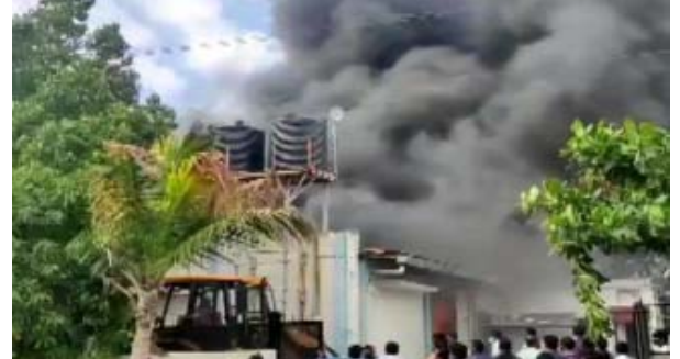
అమరావతి నేటి పత్రిక ప్రజా వార్త : పుణెలో భారీ అగ్ని ప్రమాదం చోటు చేసుకుంది. ఈ దుర్ఘటనలో దాదాపు 12 మంది సజీవ దహనం అయినట్లు సమాచారం. ఆ వివరాలు.. పుణెలోని ఫోటోవాడ ఫటాలోని ఓ కెమికల్ ఫ్యాక్టరీలో సోమవారం సాయంత్రం భారీ అగ్ని ప్రమాదం చోటు చేసుకుంది. ఫుటన చోటు చేసుకున్న సమయంలో ఫ్యాక్టరీలో 37 మంది కార్మికులు విధుల్లో ఉన్నారు. ఈ ప్రమాదంలో 12 మంది మరణించినట్లు తెలుస్తోంది. ప్రమాదం గురించి తెలిసిన వెంటనే అగ్నిమాపక సిబ్బంది రంగంలోకి దిగారు. 20 మంది కార్మికులను కాపాడారు. కొంతమంది కార్మికులను బయటకు తీసుకురావడం కోసం ప్రయత్నిస్తున్నారు. ప్రమాదం సంభవించడానికి గల కారణాలు తెలియాలి ఉంది.

ముంబై, నేటి పత్రిక ప్రజా వార్త : పుణెలో భారీ అగ్ని ప్రమాదం చోటు చేసుకుంది. ఈ దుర్ఘటనలో దాదాపు 12 మంది సజీవ దహనం అయినట్లు సమాచారం. ఆ వివరాలు.. పుణెలోని ఫోటోవాడ ఫటాలోని ఓ కెమికల్ ఫ్యాక్టరీలో సోమవారం సాయంత్రం భారీ అగ్ని ప్రమాదం చోటు చేసుకుంది. ఫుటన చోటు చేసుకున్న సమయంలో ఫ్యాక్టరీలో 37 మంది కార్మికులు విధుల్లో ఉన్నారు. ఈ ప్రమాదంలో 12 మంది మరణించినట్లు తెలుస్తోంది. ప్రమాదం గురించి తెలిసిన వెంటనే అగ్నిమాపక సిబ్బంది రంగంలోకి దిగారు. 20 మంది కార్మికులను కాపాడారు. కొంతమంది కార్మికులను బయటకు తీసుకురావడం కోసం ప్రయత్నిస్తున్నారు. ప్రమాదం సంభవించడానికి గల కారణాలు తెలియాలి ఉంది.