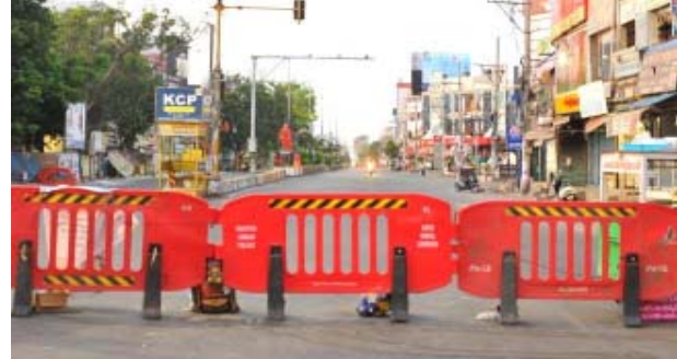
అమరావతి నేటి పత్రిక ప్రజా వార్త : కోవిడ్ నియంత్రణ చర్యల్లో భాగంగా ప్రస్తుతం రాష్ట్రవ్యాప్తంగా అమలులో ఉన్న కర్నూలు పొడిగిస్తూ ఏపీ ప్రభుత్వం

నిర్ణయం తీసుకుంది. జూన్ 20 వరకు కర్నూలు పొడిగించింది. జూన్ 10 తర్వాత ఉదయం 6 నుంచి మధ్యాహ్నం 2 వరకు కర్నూలు నడలింపు సమయం పెంచారు. ఉదయం 8 గంటల నుంచి మధ్యాహ్నం 2 గంటల వరకు ప్రభుత్వ కార్యాలయాల పని చేయనున్నాయి. కోవిడ్ నివారణ చర్యలపై ముఖ్యమంత్రి వైఎస్ జగన్మోహన్ రెడ్డి సోమవారం తాడేపల్లిలోని తన క్యాంప్ కార్యాలయంలో సమీక్ష చేపట్టారు. సమీక్షకు డిప్యూటీ సీఎం, వైద్య ఆరోగ్య శాఖ మంత్రి ఆళ్ల నాని, కోవిడ్ టాస్క్ ఫోర్స్ అధికారులు హాజరయ్యారు. ప్రస్తుతం అమల్లో ఉన్న కర్నూలు గడువు ఈ నెల 10 తో ముగియడంతో ఈ నేపథ్యంలో రాష్ట్రంలో కరోనా పరిస్థితులపై ఉన్నతాధికారులతో సమీక్షించిన సీఎం వైఎస్ జగన్.. మరో పది రోజులపాటు కర్నూలు పొడిగిస్తూ నిర్ణయం తీసుకున్నారు.