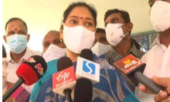
లేకపోవడంతో కేసు నమోదు చేశారు. కేసు నమోదు చేసిన తర్వాత కూడా పోలీసులతో వాదన పెట్టుకుంది. సోషల్ మీడియాలో వచ్చినవే నిజాలు అనుకోకూడదని” మంత్రి సుచరిత అన్నారు.

గుంటూరు, నేటి పత్రిక వార్త : నల్లబె బెడ్ల పైబడిన ప్రతి ఒక్కరికీ వ్యాక్సినేషన్ అందిస్తున్నామని హెంపంతుల మేకతోటి సుచరిత అన్నారు. సోమవారం అమె ఏటుకూరులో వ్యాక్సినేషన్ పరిశీలించారు. ఈ సందర్భంగా మాట్లాడుతూ, అర్హత ఉన్న అందరికీ సంక్షేమ ఫలాలు అందిస్తున్నామని పేర్కొన్నారు. సంక్షేమ పథకాల ద్వారా కేవలం రెండేళ్లలోనే లక్షలదారుల ఖాతాల్లో రూ.లక్షా 31 వేల కోట్లు చేసిన ఘనత సీఎం జగన్ కే దక్కుతుందన్నారు. అభివృద్ధి సంక్షేమానికి పెట్టడమే వేతామని, ఎన్నికల్లో ఇచ్చిన 95 శాతం హామీలను నెరవేర్చామని తెలిపారు. “గతంలో పోలిస్ ట్రైమి రేట్ చాలా తగ్గింది. చిత్తూరు ఏడేళ్ల బాలికపై అత్యాచారానికి పాల్పడిన డి.డి.పీ హయాంలో రివీల్మెంట్ హత్య జరిగితే ఏం చేశారో అందరికీ తెలుసు. దిశ చట్టం కింద 500 కోట్లతో శిక్షలు ఖరారు చేశాం. విశాఖలో కర్ఫ్యూ సమయంలో బయటికివచ్చిన యువతి వద్ద పాస్ లేదు. అనుమతి పత్రాలు