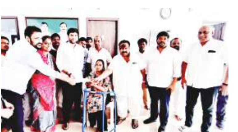
విజయవాడ, నేటి పత్రిక ప్రజావార్త :