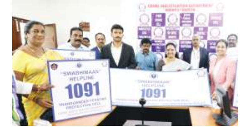
అమరావతి, నేటి పత్రిక ప్రజావార్త :