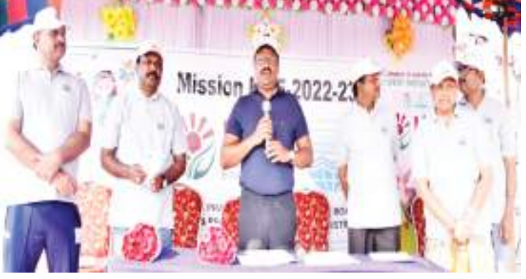
మంగినపూడి బీఓ, నేటి పత్రిక ప్రజావార్త :