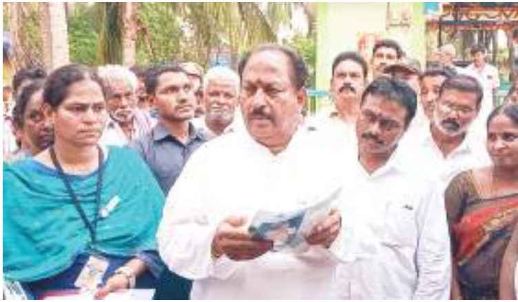
తాడేపల్లిగూడెం, నేటి పత్రిక ప్రజావార్త :