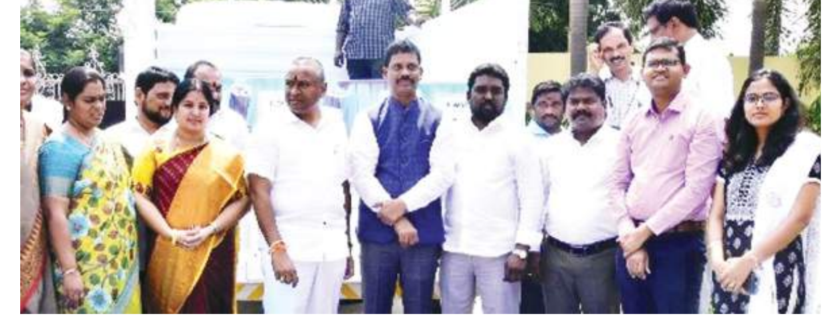
విజయవాడ, నేటి పత్రిక ప్రజావార్త :