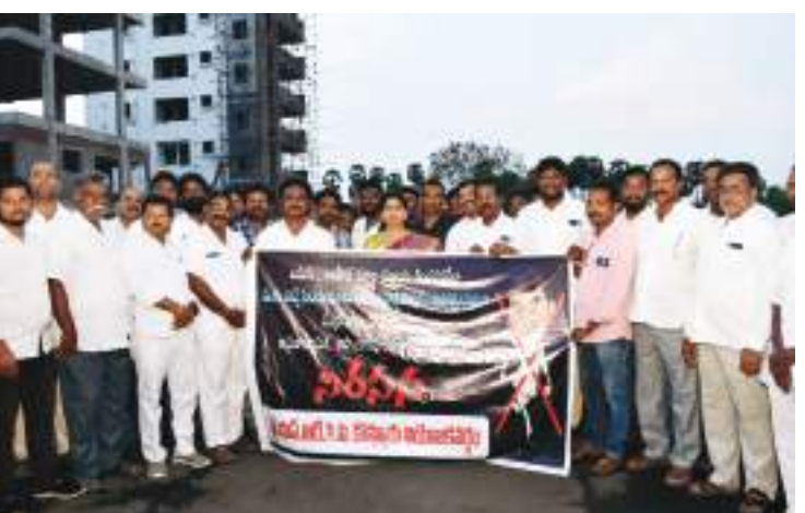
కొప్పులూ, నేటి పత్రిక ప్రజావార్త :