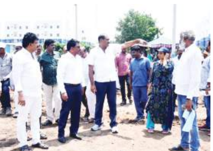
గుడివాడ, నేటి పత్రిక ప్రజావార్త :