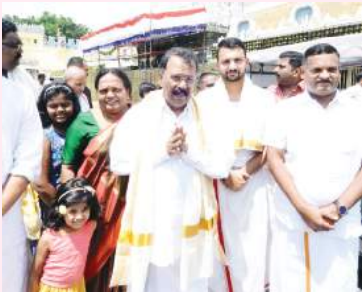
తిరుమల, నేటి పత్రిక ప్రజావార్త : గోమవారం తిరుమల శ్రీవారిని వి.ఐ.పి ప్రోటోకాల్ ద్వారా గోవా గవర్నర్ పి.ఎన్. శ్రీధర్ పిచ్చై వారు కుటుంబసభ్యులతో కలిసి దర్శించుకున్నారు.